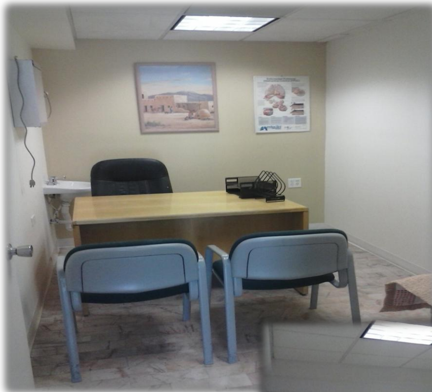
SALA ATENCION INMEDIATA