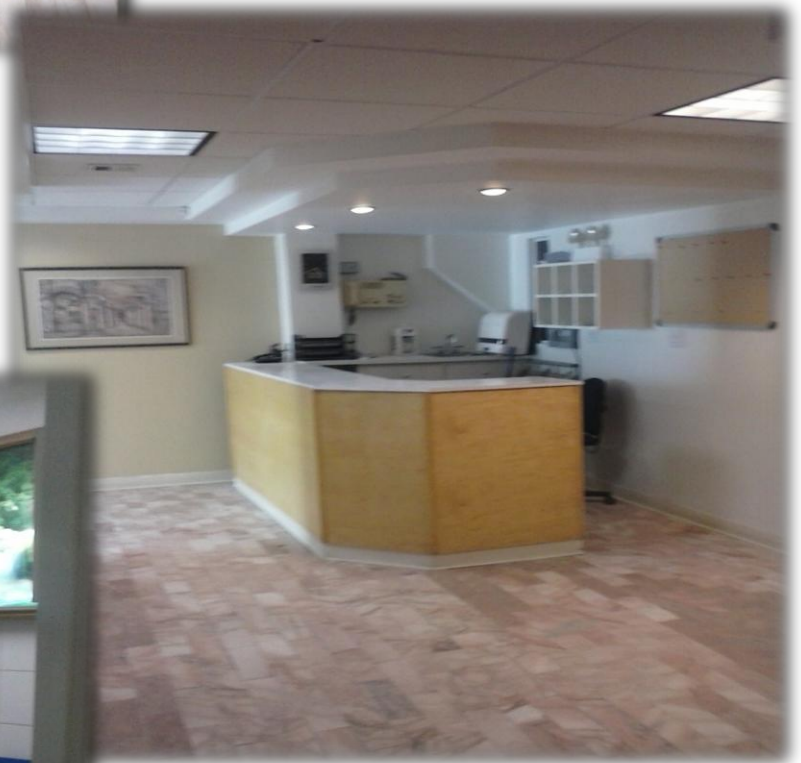
SALA DE ENFERMERIA