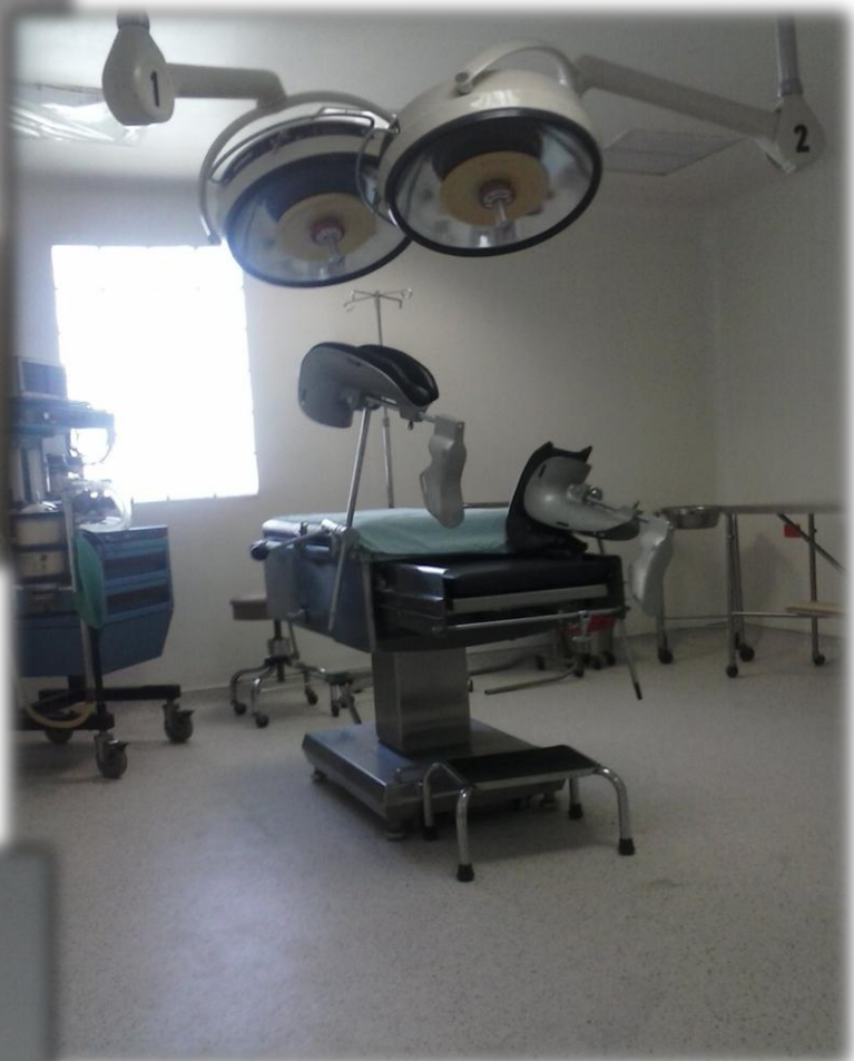
QUIROFANO 1 CESAREA / CIRUGIA MENOR