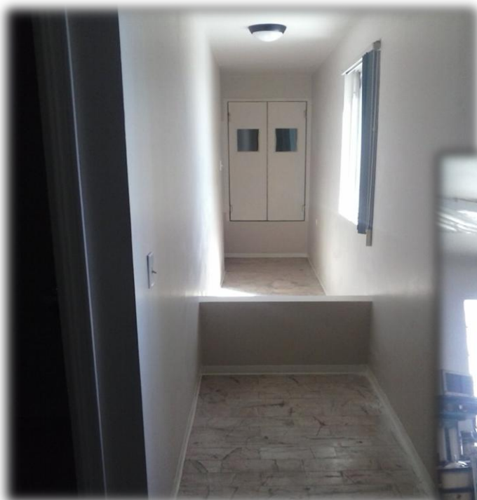
PASILLO DE ACCESO MEDICO QUIROFANO 1