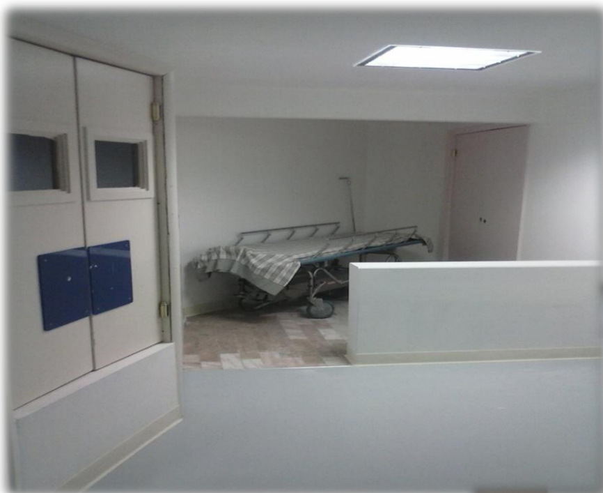
CEYE QUIROFANO 2